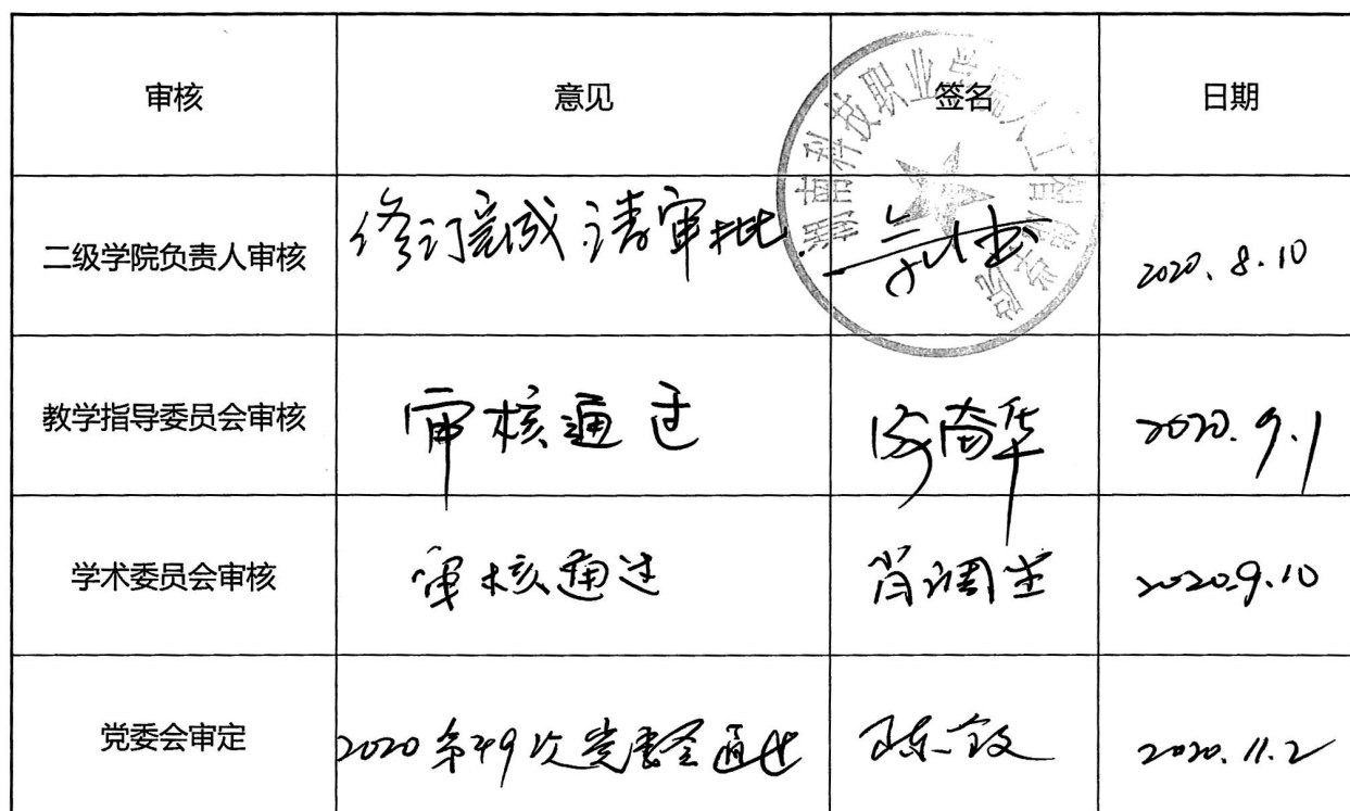
人才培养方案审核表